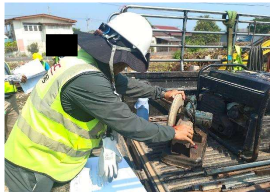
รูปที่ 2-4 การตรวจสอบสภาพเครื่องจักรและเครื่องยนต์