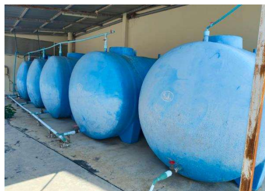
รูปที่ 2-12 การจัดเตรียมน้ำดื่ม/น้ำใช้