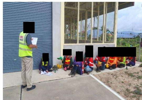
รูปที่ 2-16 การอบรมพนักงานใหม่