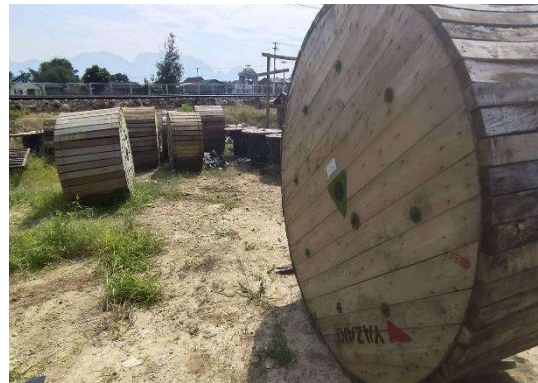
รูปที่ 2-3 พื้นที่จัดเก็บเศษวัสดุก่อสร้าง