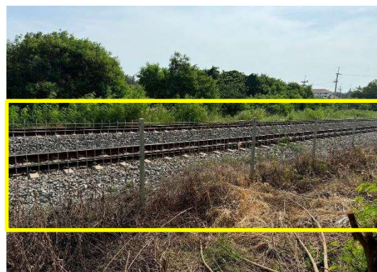
รูปที่ 2-10 การติดตั้งรั้วในเขตของการรถไฟแห่งประเทศไทย