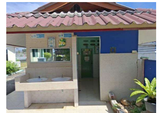
รูปที่ 2-8 ห้องน้ำ/ห้องส้วม สำหรับคนงานและเจ้าหน้าที่