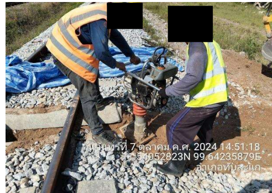
รูปที่ 2-5 อุปกรณ์หรือเครื่องมือที่ก่อให้เกิดเสียงและความสั่นสะเทือนต่ำ