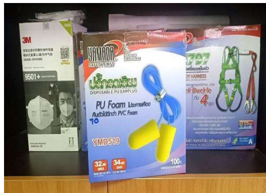
รูปที่ 2-6 อุปกรณ์ป้องกันเสียงส่วนบุคคล