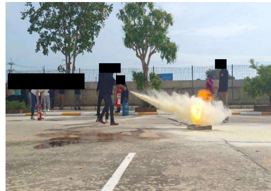
รูปที่ 2-15 การอบรมวิธีป้องกันอัคคีภัยและการใช้เครื่องมือดับเพลิงขั้นต้นอย่างถูกวิธีแก่คนงานก่อสร้างและเจ้าหน้าที่