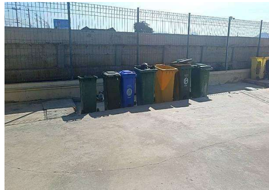
รูปที่ 2-7 ภาชนะรองรับมูลฝอย