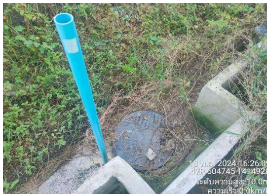
รูปที่ 2-9 ระบบบำบัดน้ำเสีย บริเวณสำนักงานชั่วคราว