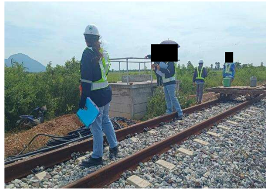
รูปที่ 2-1 การตรวจสอบการปฏิบัติตามมาตรการป้องกันและแก้ไขผลกระทบสิ่งแวดล้อม