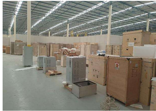
รูปที่ 2-2 พื้นที่วางกอง/จัดเก็บวัสดุก่อสร้าง