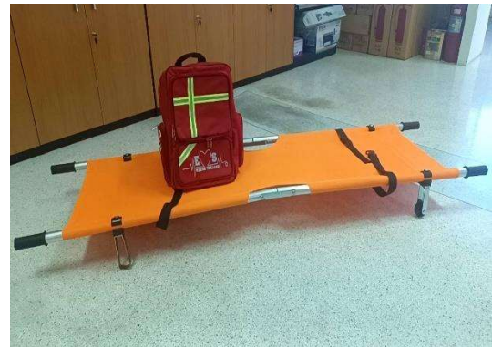
รูปที่ 2-19 เครื่องมือ/อุปกรณ์ปฐมพยาบาลขั้นต้น