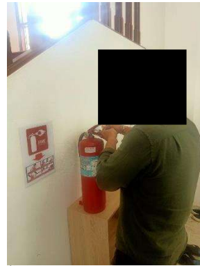
รูปที่ 2-14 การตรวจสอบถังดับเพลิงขั้นต้น