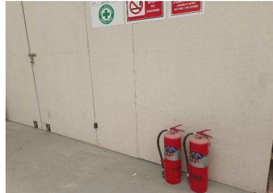
รูปที่ 2-13 อุปกรณ์ดับเพลิง