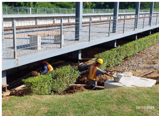
รูปที่ 2-18 การสวมใส่อุปกรณ์ป้องกันอันตรายส่วนบุคคลขณะปฏิบัติงาน