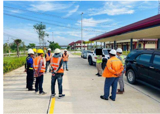
รูปที่ 2-17 การอบรม Safety talk/Toolbox talk